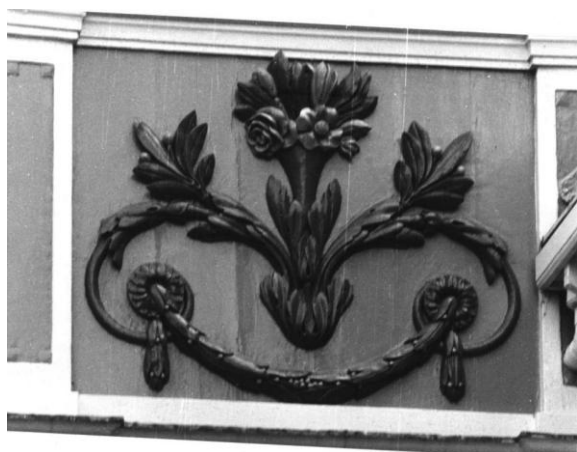
Boven: Gerestaureerde houten ornament boven de deur van Havenrak 23/25.