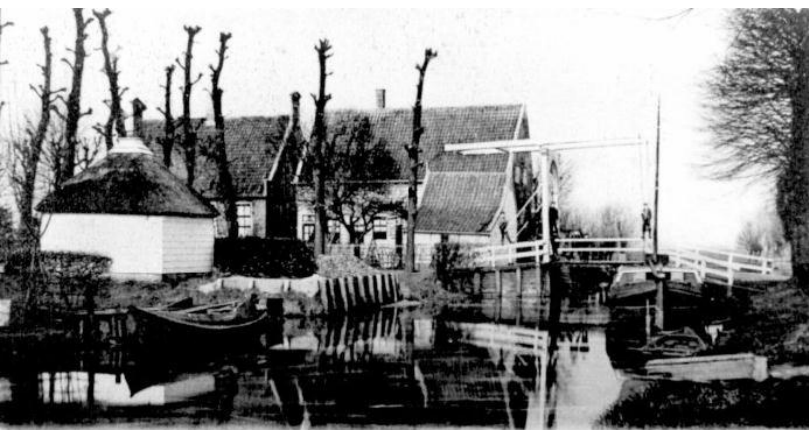
Uitgave C. Mulder Oz., Broek in Waterland.