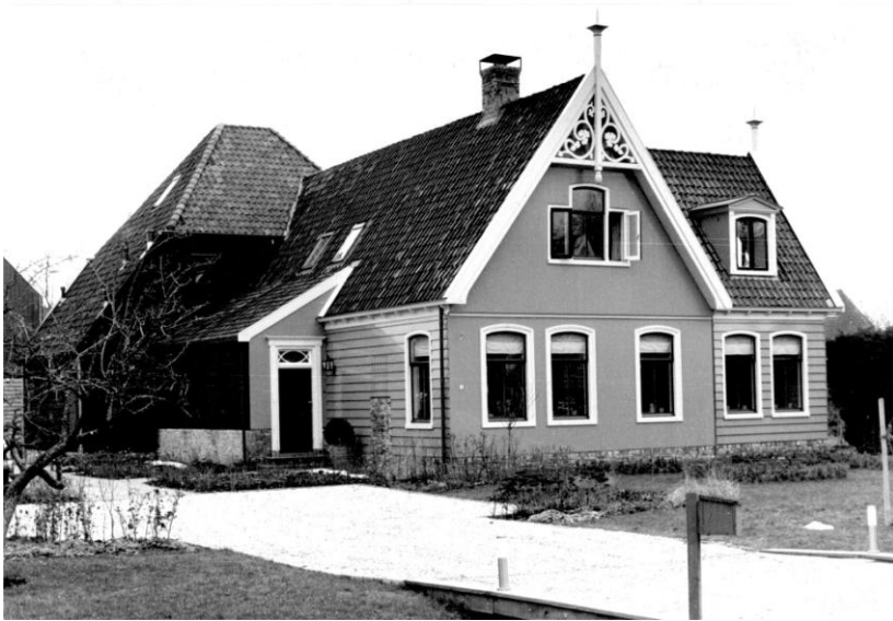
In 2003 opgerichte nieuwe boerderijvorm, met zwart (teer-kleur) voor de kaakberg en 'Broekergrijs' voor het woonhuis.