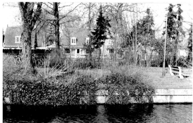
Jaagweg vroeger( Café De Zwaan) en nu (parkje en bushalte, structureel veranderd door aanleg van de provinciale weg in de jaren 30.

Na de 2e wereldoorlog brak de periode van wederopbouw aan en deed de regering er alles aan om de woningnood, volksvijand nummer één, te verslaan. Er volgde een reeks van bouwprojecten, waarbij de eeuwenoude structuur van het dorp ingrijpend veranderde. In 1948-49 werden er woningen aan Zuideinde (duplexwoningen) en Molengouw gebouwd. In de jaren 50 werd de Dr. C. Bakkerstraat aangelegd en in 1959 volgde de Cornelis Roelestraat.