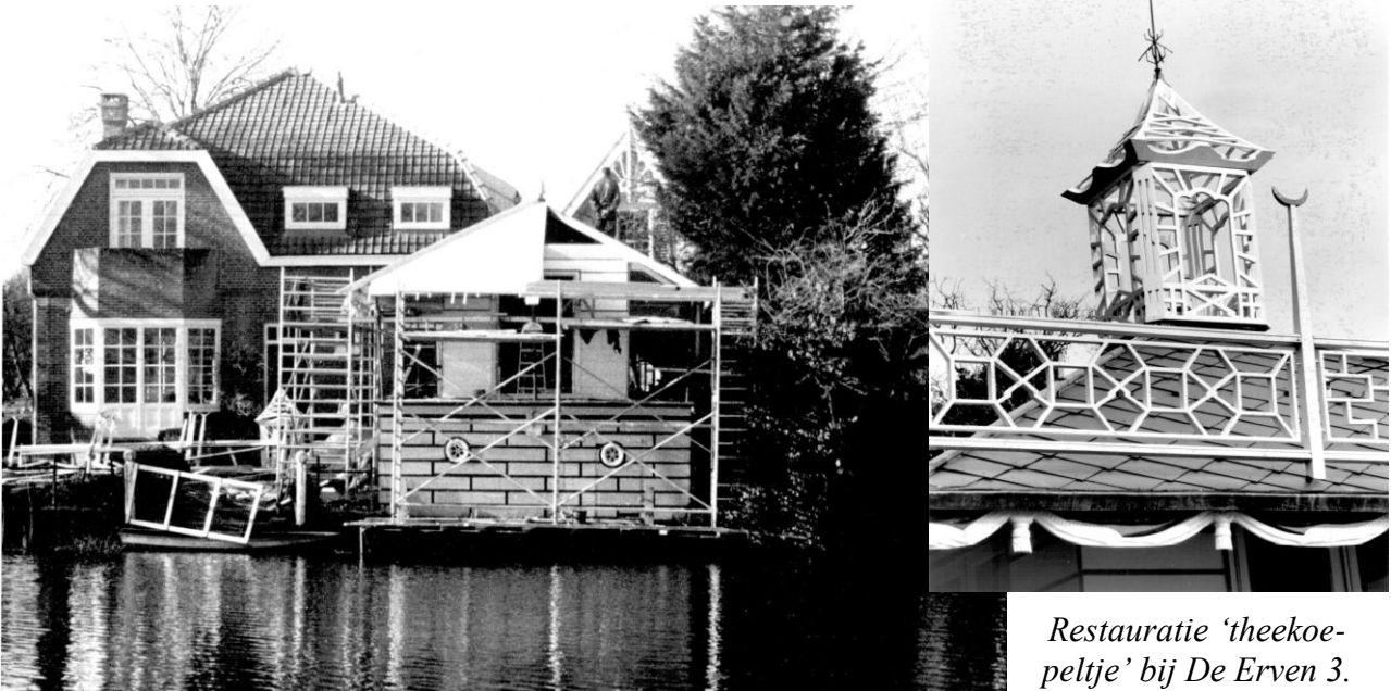
Restauratie ‘theekoepletje’ bij De Erven 3.

De constatering dat 2004 – net als 2003 – tot weinig veranderingen in het dorpsbeeld heeft geleid kan vooral positief worden uitgelegd. Nagenoeg alle monumentale panden in het beschermd dorpsgezicht zijn gerestaureerd en staan doorgaans strak in de verf. De meest markante restauratie in het verslagjaar was het herstel van het dorpsbeeldbepalende ‘theekoepletje’ bij De Erven 3. De curieuze combinatie van een ‘Chinese tent’, ‘Turkse Kiosk’, ‘Indische pagode’, etc. werd in 1793 aangelegd op initiatief van Cornelis Koker (destijds eigenaar van de twee voorname woonhuizen op de huidige percelen De Erven 10/14 en de De Erven 16), zie Broeker Bijdragen nr. 13.