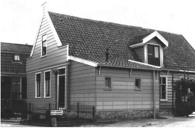
Restauratie van het uitbouwtje van Zuideinde 20.

Het laatste vervallen gedeelte van het woonhuis Zuideinde 20, vóór de monumentale open stolpconstructie, werd vernieuwd. Maar door de keuze van slechts één klein raampje heeft het uitbouwtje tussen de noord- en de westgevel vooralsnog weinig uitstraling. Ook de vier kleine naoorlogse sociale huurwoningen op Zuideinde 21 en 23 werden gerestaureerd en teruggebracht tot twee grotere woningen, zoals oorspronkelijk bedoeld. Het andere blok (Zuideinde 17 en 19) verkeert nog altijd in enigszins vervallen staat.