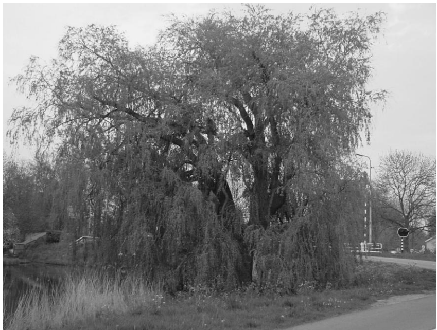
Een van de monumentale bomen van Broek in Waterland: Treurwilg Broekermeerdijk.

De vergadering wordt om 20.50 uur afgesloten. Na de pauze wordt een presentatie gegeven door de historicus Girbe Buist, met als onderwerp: Bomen en mensen, een oeroude relatie. Onder de beelden die daarbij worden gebruikt zijn een aantal recente dia's van bomen in Broek, waarmee de herkenning wordt versterkt (zie: ‘Voor- en najaarslezing’).