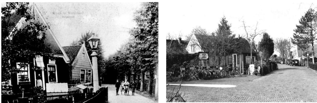
Dorpsstraat vroeger (links: kroegje, annex winkeltje ‘Wum van Daan’) en nu (links: lunch-café ‘Broeck’), structureel veranderd door aanleg van de provinciale weg in de jaren 30.

Om een drietal redenen werd aan deze ‘verkiezing’ medewerking verleend. Ten eerste zou de eventuele hoofdprijs van € 25.000,00 een mooi basisbedrag zijn om het proces van vervanging van de onooglijke ‘jaren zestig lantaampalen’ (beter bekend als ‘de UFO’s’) nieuw leven in te blazen. Ten tweede kon hiermee aandacht worden gevraagd voor de cultuurhistorische, landschappelijke, natuurlijke en recreatieve waarden van het Waterlandse landschap (bij gemeente, provincie, etc.), ter beperking van grootschalige woningbouw. Ten derde zou een verkiezing tot ‘mooiste plekje van Nederland’ kunnen leiden tot de noodzakelijke extra aandacht (financiële middelen) vanuit het rijk, de EU, etc. voor duurzaam agrarisch natuurbeheer, milieuvriendelijke productiewijzen, gezonde biologische producten, zeldzame flora en fauna, etc., zie: ‘Excursie Waarden van Waterland’ .