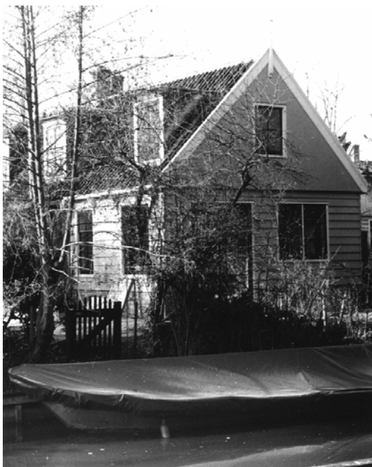
Uitbreiding woonhuis Roomeinde 10.