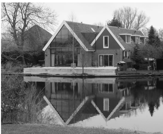
Veranderingen in het aanzicht van het Zuideinde.

Noodzaak om het Zuideinde, de Eilandweg en een deel van de Molengouw alsnog aan te wijzen als beschermd dorpsgezicht.