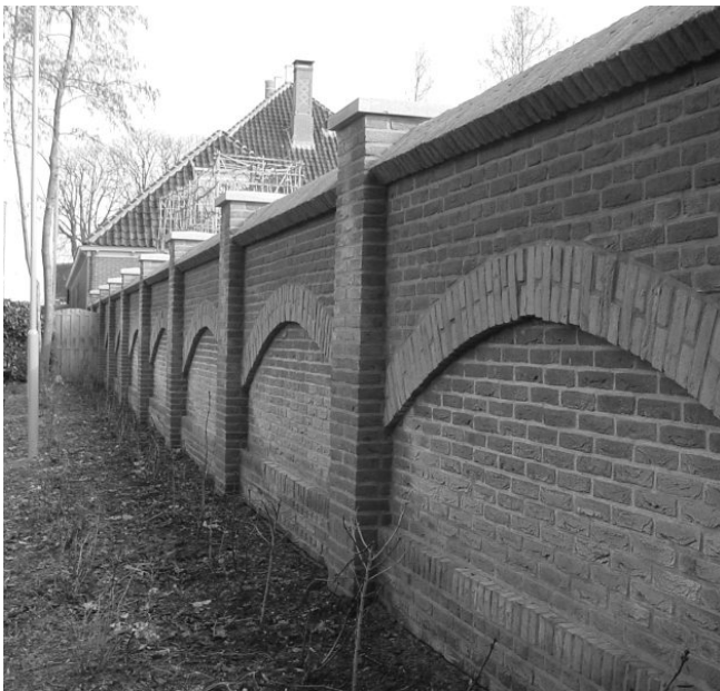
Hoge stenen schutting achter De Erven 4

Vanuit voorgaande alinea en onderstaande alinea's d) en e) moeten we constateren dat de gemeente Waterland niet of nauwelijks inhoudelijk gereageerd heeft op de zienswijzen, bezwaarschriften en inspraakreacties. En voorzover wèl: vrijwel altijd afwijzend. De gemeente houdt meestal hardnekkig vast aan haar eigen lijn, tegen de uitdrukkelijke wens van vele dorpsbewoners in. Daarbij wordt het particuliere belang van het individu vaak boven het algemeen belang voor de gemeenschap gesteld. Dat leidt onherroepelijk tot een verdere verharding van standpunten en een verdieping van de kloof tussen bestuur en burger. Hopelijk brengt een vernieuwd gemeentebestuur hier in 2006 nadrukkelijk verandering in!