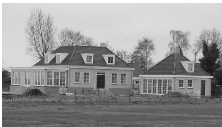
Nieuwbouw aan de Burgemeester Peereboomweg, zonder enige vorm van cultuurhistorisch besef.

Het houten woonhuis Molengouw 28 zal worden gesloopt en vervangen door nieuwbouw. Hopelijk wordt er komend jaar iemand gevonden die zich ontfermt over de voormalige wolwinkel aan het Roomeinde nr. 12 en/of de prachtige historische kaakberg achter Eilandweg 15-17, zodat ook deze objecten in oude luister kunnen worden hersteld.