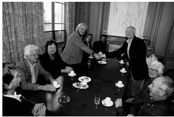
Overdracht van 'tafel en stoelen' aan het bestuur van de Stichting Het Broekerhuis.

De onder de inkomsten jubileumviering vermelde bedragen zijn als volgt opgebouwd: