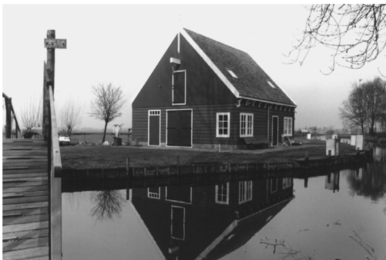
'Nieuw Botenhuis' op het terrein van Zeilschool Waterland.

De vergadering wordt om 20.45 uur afgesloten. Na de pauze wordt een presentatie gegeven door prof. dr. G.J. Borgers over de ontstaansgeschiedenis van Waterland. Meer daarover vindt u onder het kopje: 'Voor- en najaarslezing'.