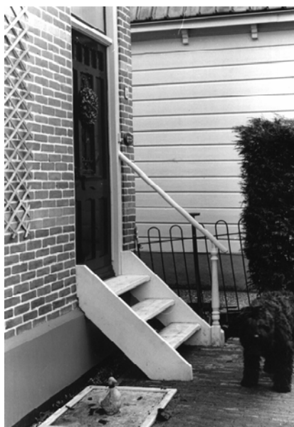
Kleinschalige veranderingen in 2005, zoals Laan 14.

Meer kleinschalige veranderingen betreffen o.a. de schuur van Noordmeerweg 12, herstelwerkzaamheden aan de stenen fundering van Laan 14, het Rabo-fietsroute plakkaat 'Gezicht over het Havenrak', isolatie van het dak van Eilandweg 3 en herstel van de oorspronkelijke gevelindeling van Eilandweg 5a.