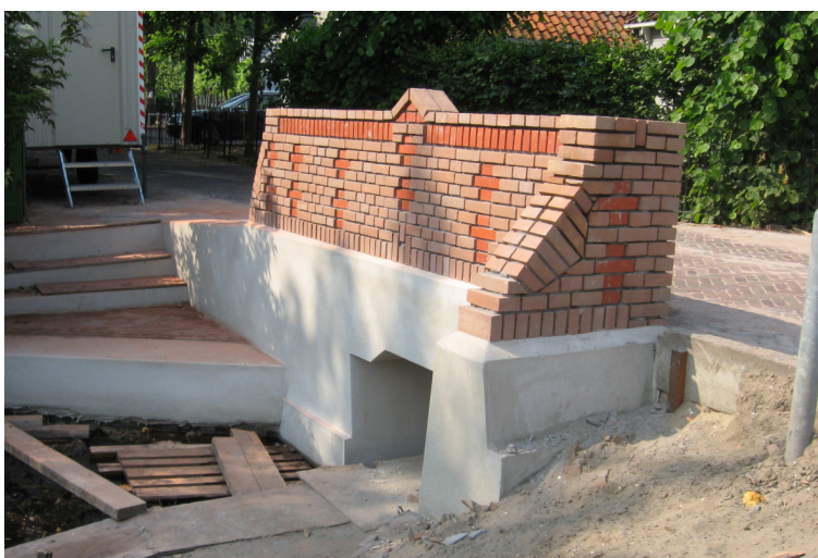
Een nieuw stenen bruggetje tussen Havenrak en Kerkplein, naar voorbeeld van zijn voorganger.

Zuideinde 3 kreeg een heel ander aanzien door restauratie werkzaamheden en rigoureuze verwijdering van beplanting: absoluut een verbetering van het aanzicht van toekomstige uitbreiding van het Beschermd Dorpsgezicht. Het stenen woonhuis Eilandweg 15-17 werd hersteld, maar de karakteristieke achterliggende kaakberg staat er nog vervallen bij. Als meest opvallend schilderwerk in 2007 kan worden vermeld: Leeteinde 22-24 werd na vele jaren van één kleurstelling voorzien; Wagengouw 6 kreeg het zelfde 'Broekergrijs' als wederhelft Wagengouw 4; het marmer schilderwerk op de zuilen van de barokke voorgevel (1775) van Laan 22-28 werd hersteld; de raamkozijnen van het liefallige pandje 'De kleine walvis, Zuideinde 16' werden opvallend groen geverfd. Zeer speciale vermelding verdient tenslotte de opening van een 'Bijzondere dierenwinkel' in de voormalige 'Spar' aan de voorzijde van Roomeinde 14-16.