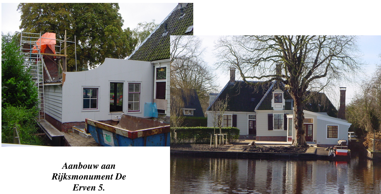
Aanbouw aan Rijksmonument De Erven 5.