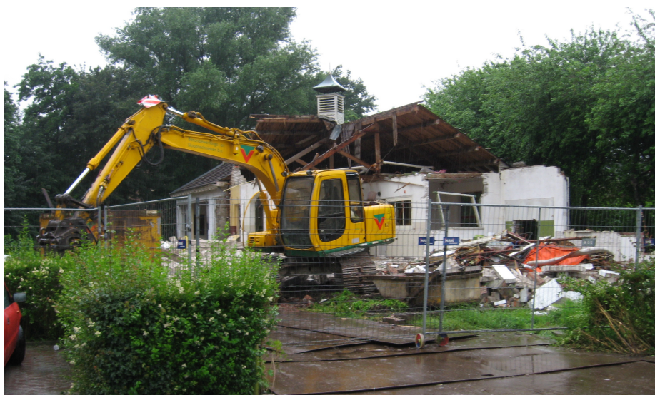
Verdwijning van het Stokpaardje én de bijbehorende boomsingel op de hoek van de Dr. C. Bakkerstraat en de C. Beekstraat

Op het gebied van het Broeker Groen valt het kappen van de prachtige boomsingel rond het terrein van het Stokpaardje te betreuren. Wederom is men bij het bouwproject uitgegaan van een leeg tekenbord, waarbij de bomensingel moest worden geruimd. Hoewel, niet helemaal: Een klein deel van de bomensingel werd alsnog gespaard, waaronder enkele elzen en de meest imposante boom (wilg) in de hoek van het terrein. Door deze boom toe te voegen aan de lijst van waardevolle bomen in de gemeente Waterland werd de kap voorkomen.