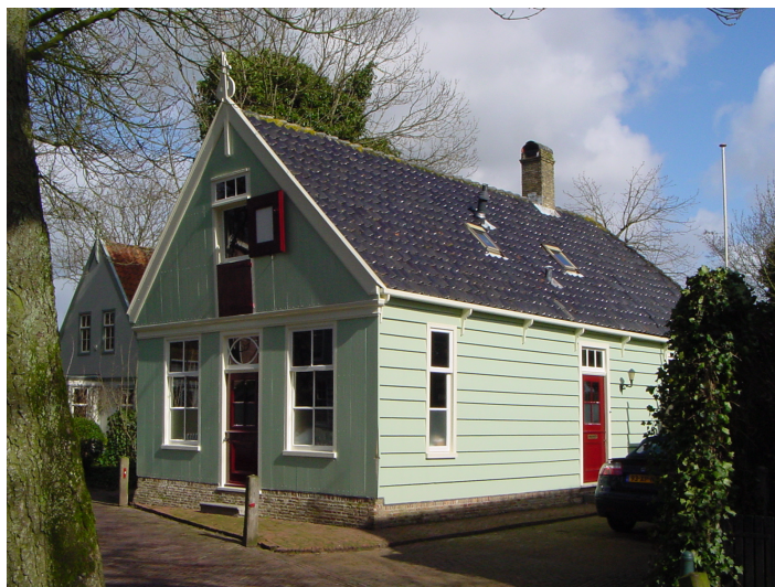
Schilderwerk Leeteinde 22-24

Een opvallende verandering in het dorpsbeeld is de aanbouw van De Erven 5. Het resultaat vormt een minder harmonisch geheel dan de aanvraag (bouwtekening) deed vermoeden. Het is vooral jammer dat het grappige klokgeveltje aan het Havenrak vooralsnog niet is gerealiseerd. Juist daarmee wordt gerefereerd aan de situatie van het begin van de 20 ste eeuw. Zeer lovenswaardig zijn wel de mooi herstelde tuinen en hekwerken rond De Erven 5.