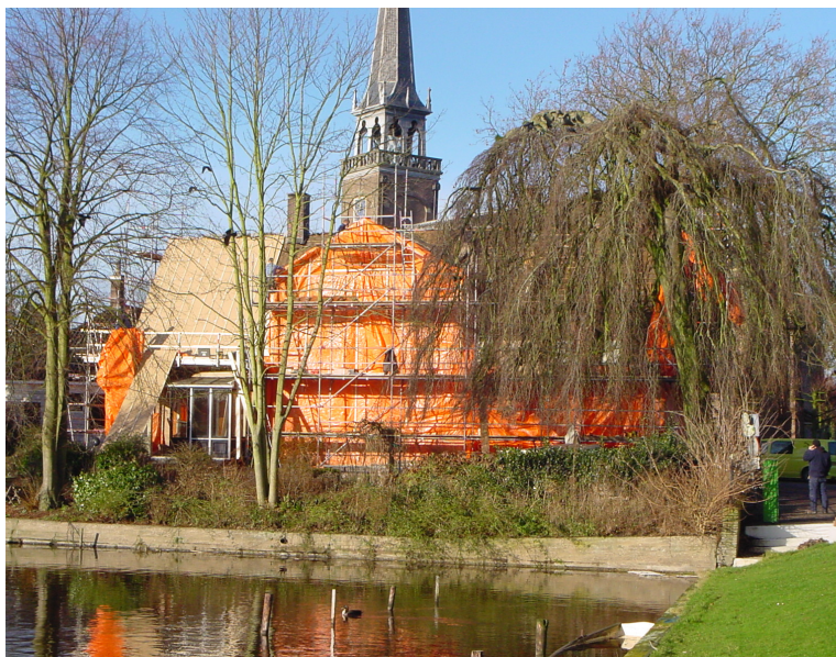
Na verwijdering van het ‘silverfolie’ werd Kerkplein 11-12 opnieuw ingepakt, ditmaal in ‘oranje plastic’.