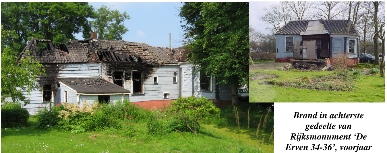
Brand in achterste gedeelte van Rijksmonument 'De Erven 34-36', voorjaar