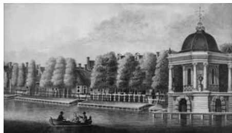
De bovenstaande 2 litho's 'lopen in elkaar over'