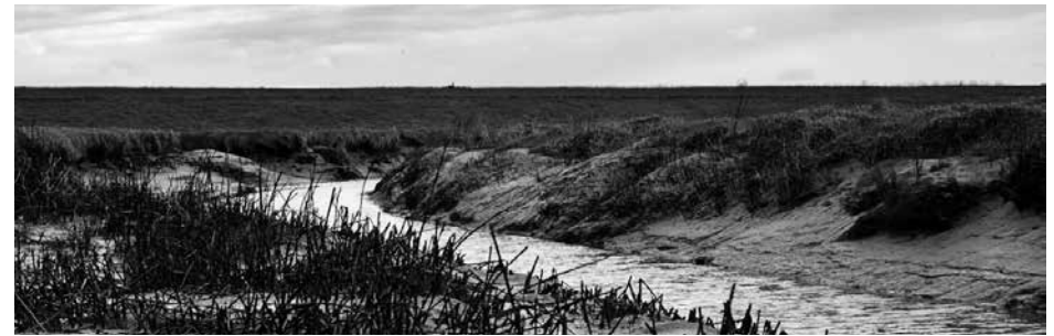
Het Verdrongen Land van Saeftinghe