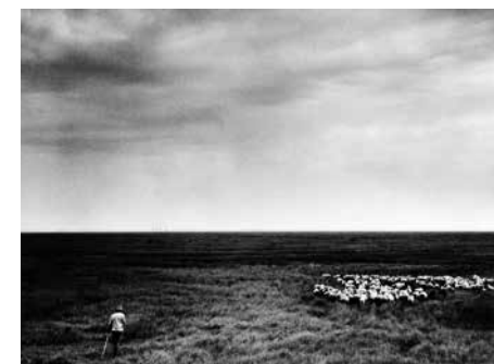
Met de klok mee: de kaasmakerij, het opkomende klaverland, met de pinkenbul in de koestal en schaapherderstijd in het Verdrongen Land van Saeftinghe.