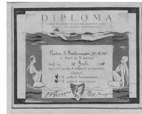
Zwemdiploma Piet Ruijterman

Anja zegt, dat je niet nadacht over de vraag of je zwemles leuk vond: je ging gewoon. Ook Dick ging - maar niet graag. “Ik was zes jaar, bang, stond te bibberen op dat kleine steigertje. Dan zag je die kouwe band die je om je bast kreeg en dan moest je dat trapje van de steiger af, het water in. Of je werd het water in getrokken. Tweemaal heen en weer langs de steiger, dan had ik het wel gehad.”