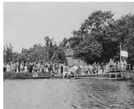
Grote drukte bij de steiger aan De Erven, waar voor het diploma wordt gezwommen.