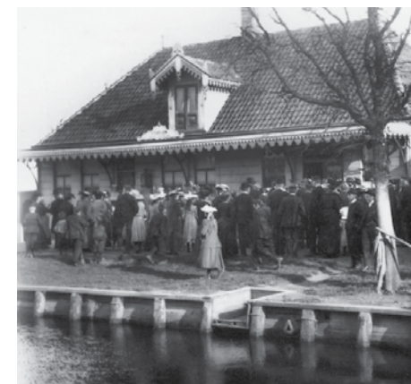
De toeristen keren huiswaarts met de tram