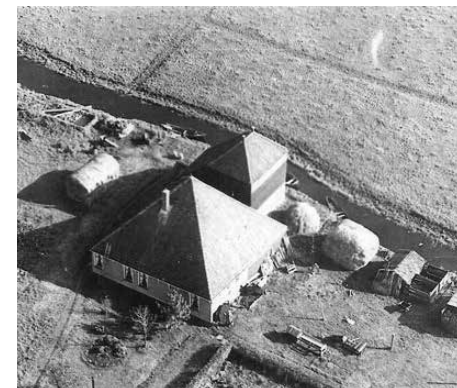
Wagengouw 3, rond 1950

gehad." Janny: "Jawel hoor, we hebben immers neven die konden melken, maar dan leerden onze nichten het ook."