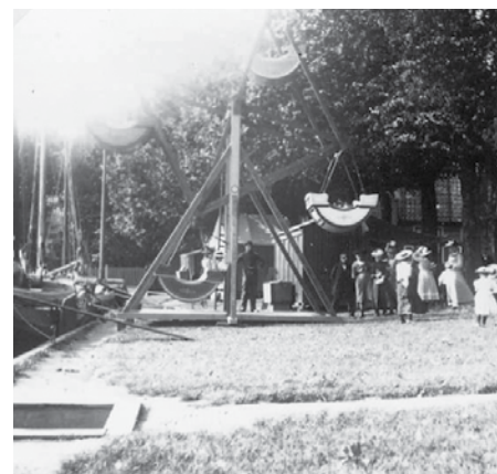
De populaire kermis met een Turkse schommel