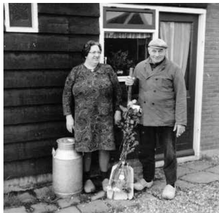
26-04-1977, gestopt met bedrijf