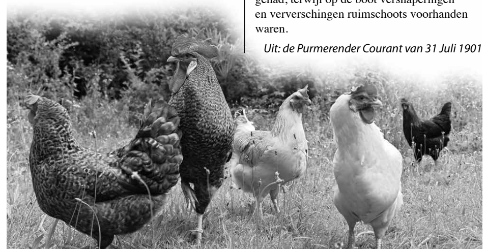
Uit: de Purmerender Courant van 31 Juli 1901

Uit: de Purmerender Courant van 31 juli 1901