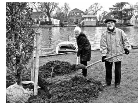
Ot en Lydia plaatsen de boom

Meer details in oudbroek.nl december 2012.