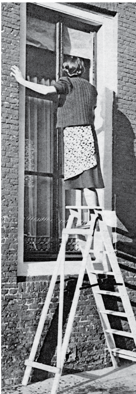
Tot ongeveer 1940 was er de jaarlijkse opknappingsbeurt in Broek in Waterland