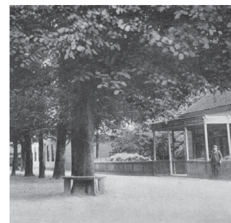
Café Ubbels biedt verkoeling