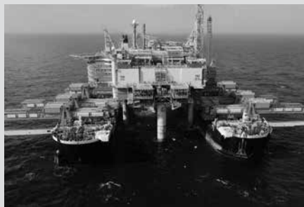
De Pioneering Spirit

Net als vorig jaar wordt het weer een bijzondere excursie . Bezoek aan het Historische Centrum van Delft (een pareltje) in combinatie met kennismaking met de Maasvlakte (tussen Rotterdam en Hoek van Holland) waar op spectaculaire wijze geschiedenis geschreven wordt door de uitbreiding van de nu al grootste haven van Europa. Thuishaven van het grootste schip ter wereld: de Pioneering Spirit, 382x127 meter, welke in 1 keer een heel platform oppakt en versleept van 48.000 ton.