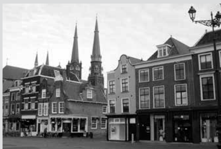
Historisch centrum van Delft