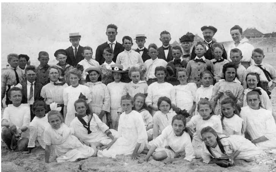
Wijk aan Zee, 1918

te wachten. Wie het eerst beneden was, kreeg een ijsje. Weten jullie nog? Je zat van tot top teen onder het zand."