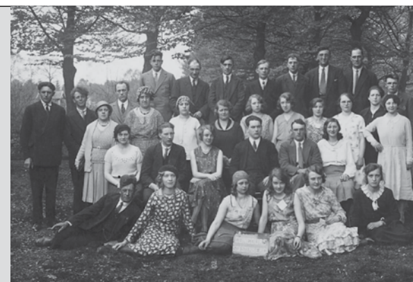
Deelnemers concours Soesterberg