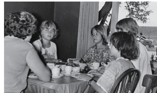
Groet, eind jaren zeventig.