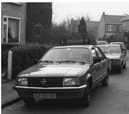
Lesauto in vroeger jaren