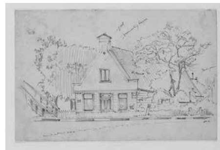
Jaagweg 1 Stöve met Kippenbrug