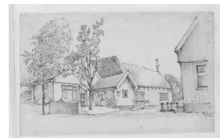
Kerkplein 10, daarachter Keerengouw 2 en rechts Havenrak 1

Hij heeft niet zo heel erg lang in Broek in Waterland gewoond - van midden 1941 tot 1950. Piet Kok maakte in die periode heel veel tekeningen en ook wel schilderijen van zijn woonomgeving. Hij schreef er de bijzonderheden bij van de boerderij, de landweg of de mensen die hij als onderwerp had gekozen.