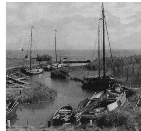
De haven van Uitdam

In de winter van 1946 moest Dirk twee avon-