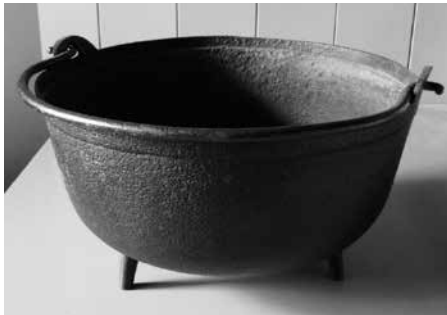
Gietijzeren vuurpot uit het huis van bakker Oly, Havenrak 1.