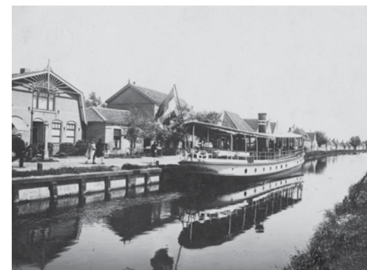
Waarschijnlijk zaten de leerlingen in een dergelijke boot. Dit is de 'Geulstroom', die voer o.a. van Amsterdam naar Broek in Waterland en Marken.

Een zestigtal der grootste leerlingen der openbare lagere school in Wijk I hadden vrijdag 11 juli een aardig 'uitje' naar Haarlem en Omstreken. Zij vertrokken onder geleide van het onderwijzend personeel per stoomboot naar Haarlem, bezochten verder per spoor Zandvoort, wandelden naar Bloemendaal en maakten van daar een toertje in eenige rijtuigen, die hen weder naar de boot in Haarlem brachten. Des avonds ongeveer te negen uur kwam de boot weder te Broek. Het gezelschap was toen vermeerderd door het Fanfarecorps dat de feestzangers aan het Schouw had opgewacht en het laatste gedeelte van den tocht door eenige vrolijke wijsjes opluisterde.