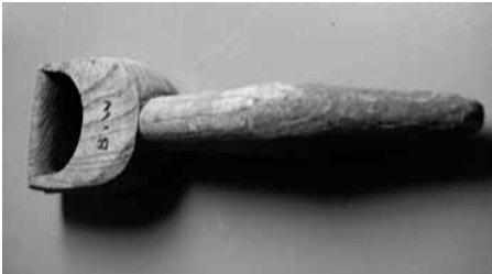
Houten bloembollensteker. Ingebrande letters B i W. Gebruikt door gemeentewerklieden.