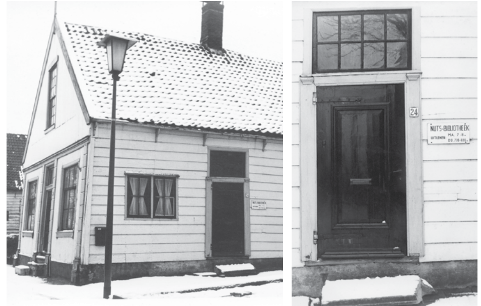
Nuts-bibliotheek Laan 24