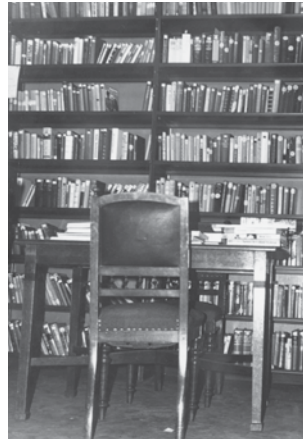
Links: de uitleentafel en rechts zelfs boeken in de bedstede. (1972)