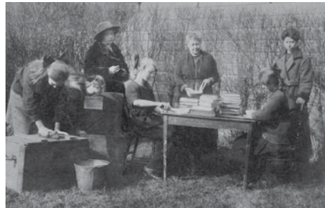
De boeken van de reizende bibliotheek worden schoongemaakt in de achtertuin van Dorpsstraat 20. Links een verzendkist.