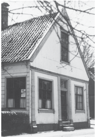
Nuts-bibliotheek Laan 24