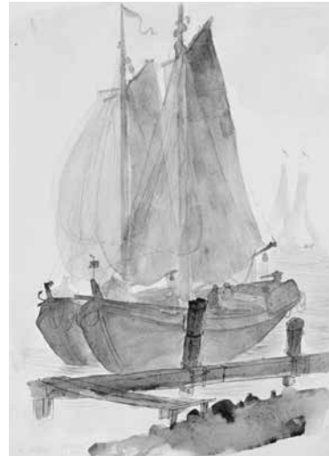
Botter in Volendam

Tentoonstelling tekeningen van Peter Spier van 23 augustus t/m 2 oktober in de Broeker Kerk. U kunt ook nu weer voor 15 euro per stuk reproducties van de tekeningen kopen.