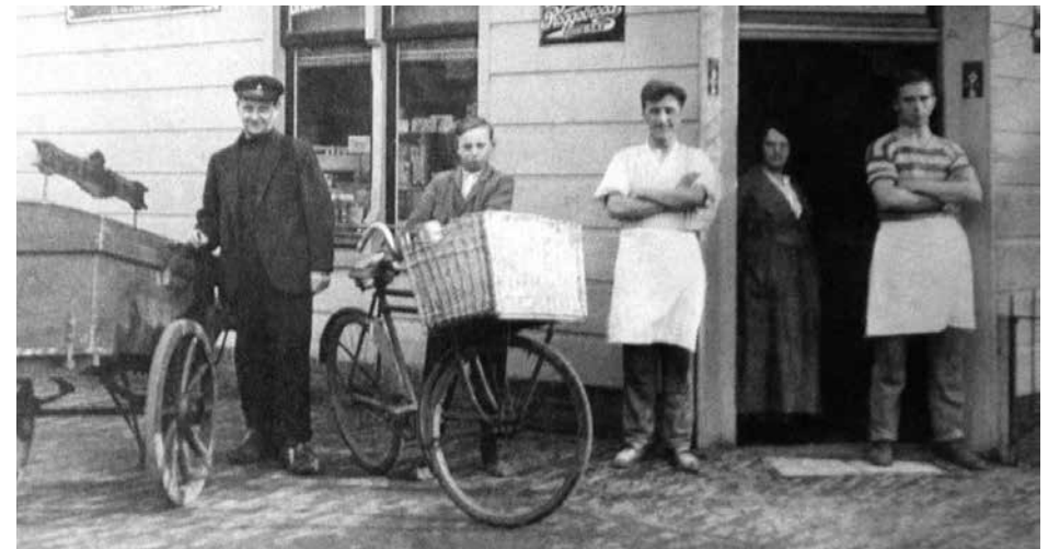
De winkel van bakker Bijl na de verbouwing met grote etalage op de hoek Eilandweg (nr. 5)

'k Heb eens een flink pak slaag van hem gehad. Ik kwam hem tegen in schemeravond, alleen, en zei, door die angst waarschijnlijk: "Dag meneer Keessie van Wum". Nou werd hij natuurlijk nooit meneer genoemd en Keessie van Wum was een scheldnaam. 'k Heb het geweten, hoor.