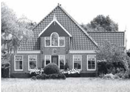
De nieuwe boerderij