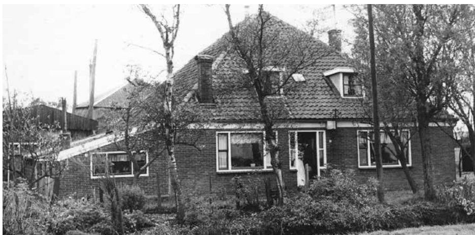
De verzakte oude houten boerderij uit 1895