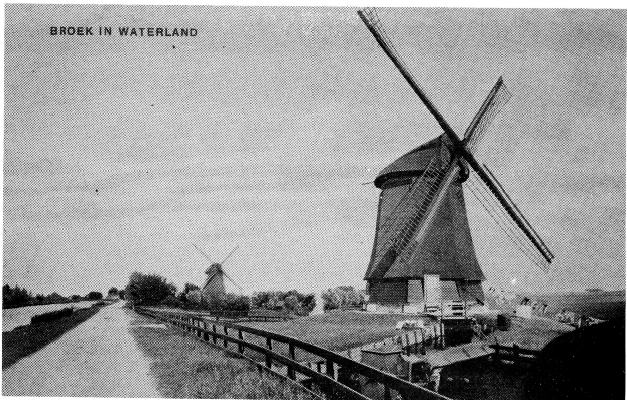
De beide reeds lang verdwenen watermolens aan de Broekermeerdijk.

Dit jaar, 1978, wordt herdacht dat 350 jaar geleden de drooglegging van de drie Waterlandse meren na jarenlange inspanning tenslotte een feit was geworden. Naar verluidt wordt in de plannen ter viering van deze herdenking ook op allerlei wijzen aandacht geschonken aan de geschiedenis van elk der meren, en meer speciaal van de Broekermeer. Om andere plannen niet te doorkruisen en toch niet geheel achter te blijven wordt in dit nummer van de Broeker Bijdrage het artikel herdrukt dat W. van Engelenburg in 1928, juist 50 geleden, in de Provinciale Noord-Hollandsche Courant schreef over de jaren tijdens en direct na de drooglegging. De illustraties zijn van redactiewege toegevoegd.