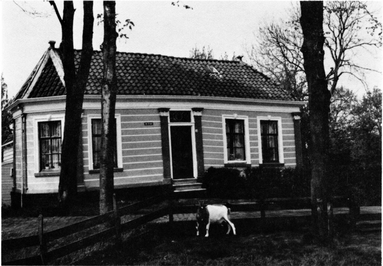
3. Voorgevel van het huis De Erven 34-36. Foto uit 1983.

1783. Dit meisje trouwde in 1802 en stierf het jaar daarop. Bakker zelf overleefde vrouw en kind. Hij overleed in 1836 en liet huis en park na aan Abraham Isaac van der Beek. Een Engelse reiziger, die hier was in 1838, beschrijft het huis dan als een 'elegant painted and gilt mansion' 7) . Nog in 1862 wordt deze Van der Beek als eigenaar vermeld 8) .