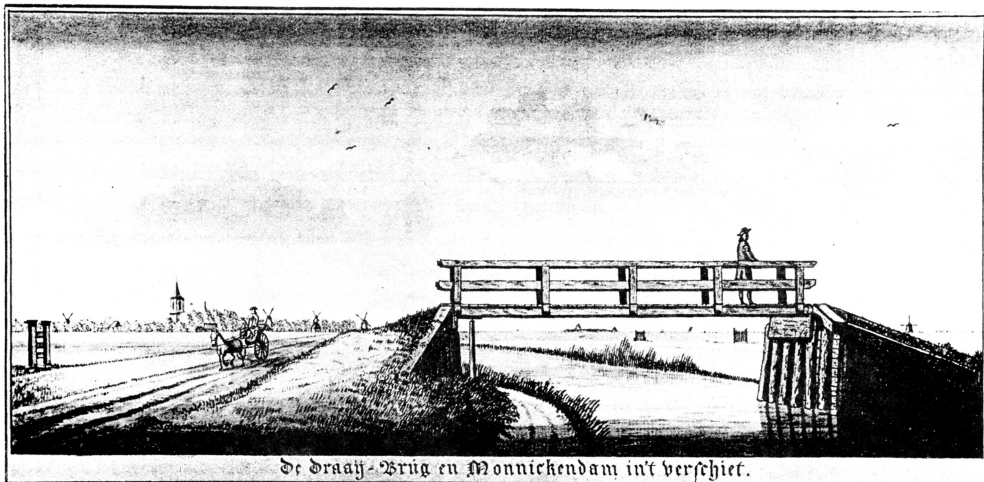
"De draaij-brug en Monnickendam in 't verschiet" (Schoon 1759)