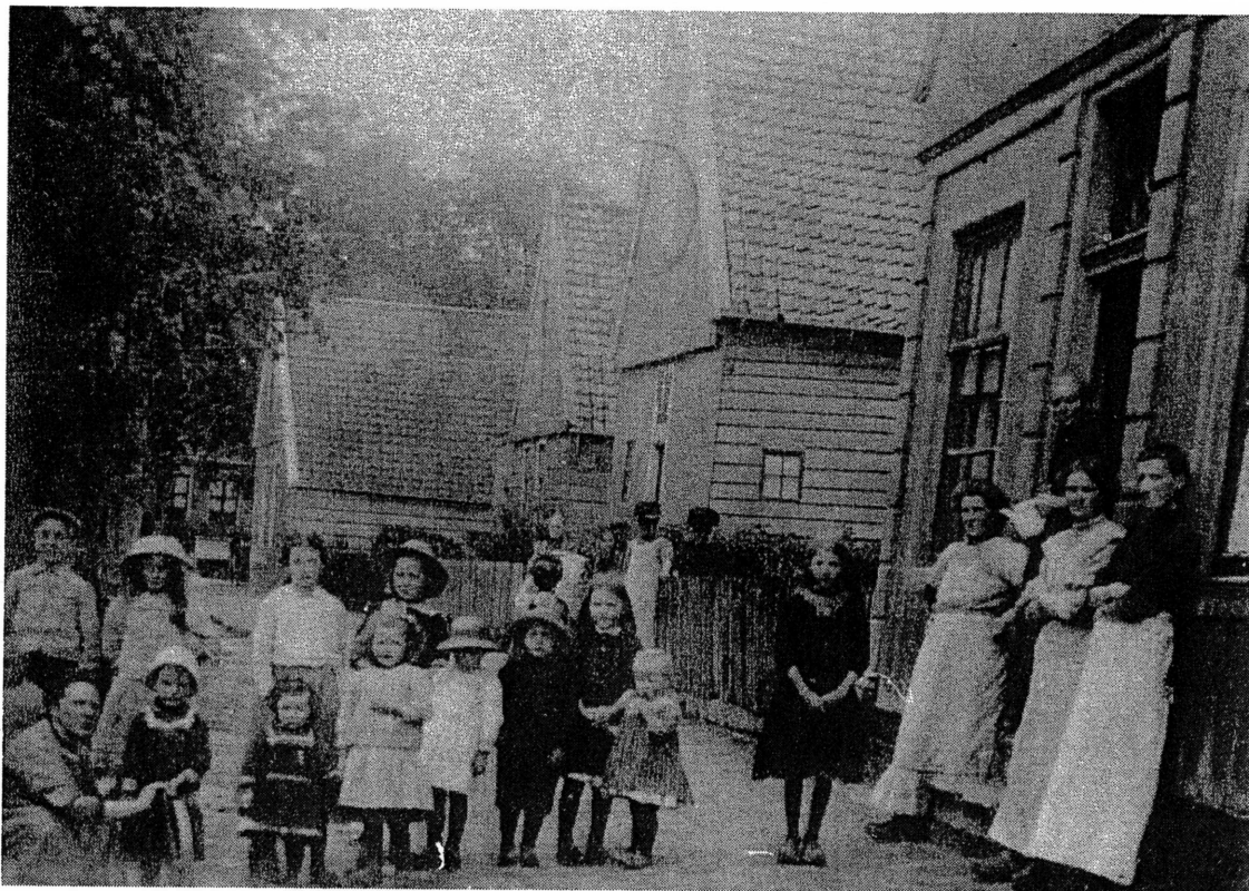
Afbeelding 3) Enkele kinderen van de Bewaarschool Ao. 1915 poserend op De Laan, ter hoogte van het huis nr. 22