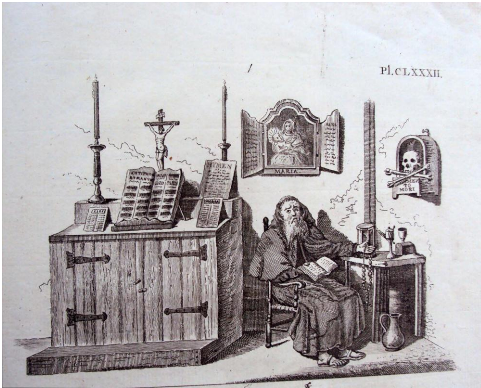
Afb. 3. Heremiet, een Ledeman zynde, in zijn kluis de vergankelijkheid van al het aardse overdenkend. Illustratie in Magazyn van Tuyn-Sieraaden door G. van Laar (1 e druk 1802)