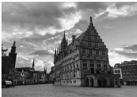
Oude stadhuis van Gouda.

Tussendoor kregen we een rondleiding door het oude stadhuis van Gouda. Op zich bijzonder op een zaterdag, want trouwerijen gaan altijd voor maar gelukkig we konden we vóór een trouwerij ingepland worden. Met de bouw werd begonnen in 1448 nadat de grond in 1395 reeds was aangekocht. Het interieur stamt nog uit de 17e en 18e eeuw.