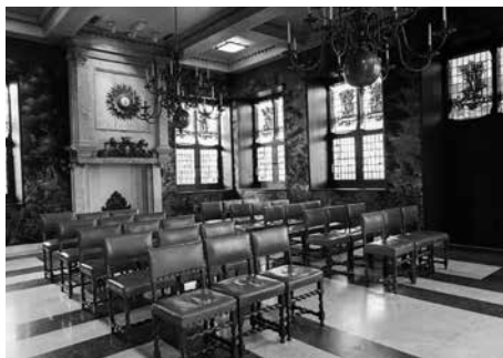
Trouwzaal oude stadhuis van Gouda.

Met de oplevering van het nieuwe stadhuis in 2012, met in de gevels het patroon van een stroopwafel, is het niet meer als stadhuis in gebruik maar alleen nog als trouwlocatie en voor allerhande festiviteiten.