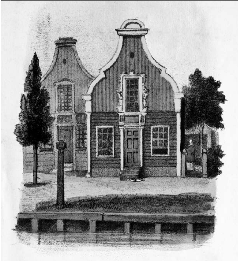
Misschien Roomeinde 37-39 maar kan ook een sedertdien verdwenen huis in Broek zijn (litho door Meyer & Co. Uitgave F. Buffa, A'dam, ca. 1850)