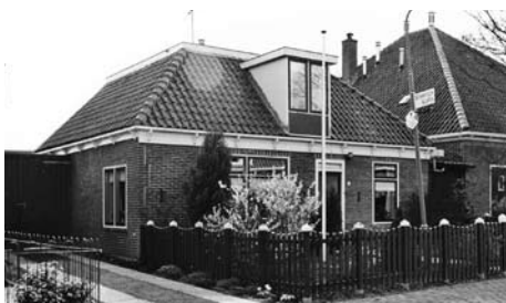
Molengouw 12 voor de verbouwing...