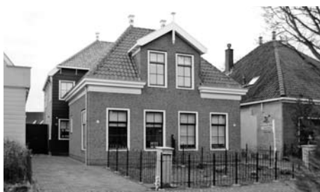
... en na de verbouwing.

'op zijn plek te laten vallen', maar het straatbeeld gaat er met deze woning op vooruit.