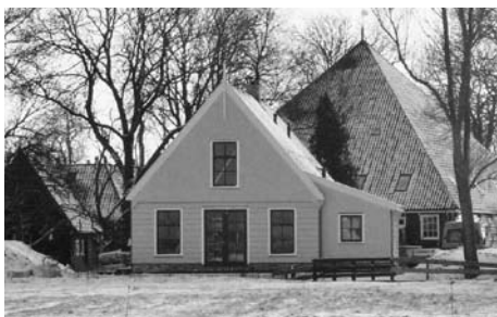
Nieuw huis in de boomgaard van Leeteinde 5.

De woning achter Leeteinde 5 is eveneens ge-slaagd te noemen. Uiteraard heeft de woning door zijn plaatsing een deel van het vrije uitzicht op het achterliggende landschap weggenomen. Zeker voor de direct omwonenden een reden tot ontevredenheid. De woning op zichzelf staat er echter op een bescheiden manier mooi bij.