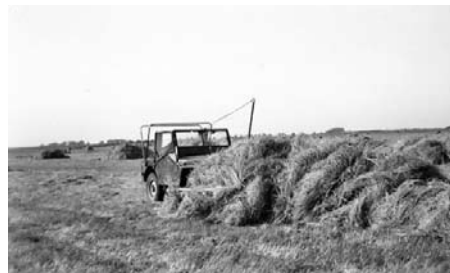
Hooischuiver jeep (ca. 1938)

25 mensen hebben de vereniging vragen en opmerkingen doen toekomen. De meeste vragen konden beantwoord worden. Er zijn ook foto's en verhalen ingestuurd en een tweetal mensen hebben we aan een digitale landkaart kunnen helpen.