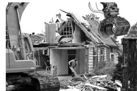
Afbraak van Laan 46 (hoek Dorpsstraat)

Het beschermde dorpsgezicht is in 2012 opnieuw weinig veranderd, dat is natuurlijk ook inherent aan een beschermd dorpsgezicht. Naast een aantal kleine veranderingen aan de bestaande bebouwing, zijn het na genoeg nieuw opgetrokken woonhuis aan het Roomeinde, aan de oever van de Dee en het nieuwe woonhuis achter Leeteinde 5 de grootste veranderingen. De meest in het oog springende verandering is natuurlijk de sloop van de voormalige winkel van Gerrit Mulder.