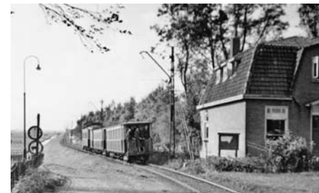
De tram verlaat voorgoed het dorp.