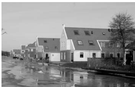
De Veenderijgouw aan de Veenderijvaart.

Buiten het beschermde dorpsgezicht is er sprake van veel grotere veranderingen. Het woningbouwcomplex aan de Veenderijvaart is in zijn geheel uitgevoerd. Ruim zestig gezinnen hebben in deze passende aanvulling van het dorp een plek gekregen. Natuurlijk zijn er nog een aantal aanloopproblemen, zoals de ontsluiting en de definitieve inrichting van de openbare ruimte. In zijn geheel kan deze nieuw toegevoegde woonwijk wel degelijk als geslaagd worden benoemd.