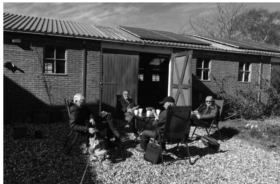
Bestuursvergadering in corona tijd.