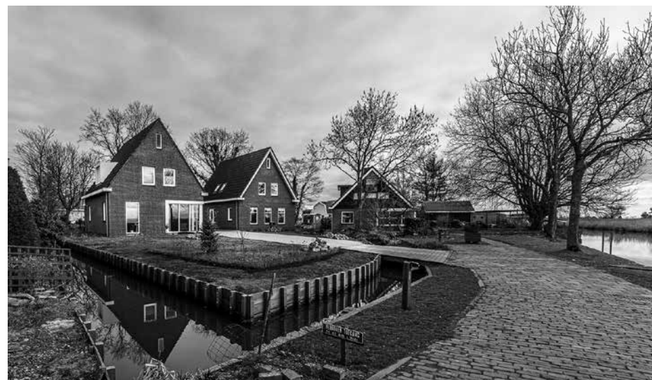
Er zijn 2 woningen gebouwd aan de Molengouw aan het einde nabij de ark van mevrouw de Boer.

Molengouw 16: Slopen bestaande woning en bouwen nieuwe woning.