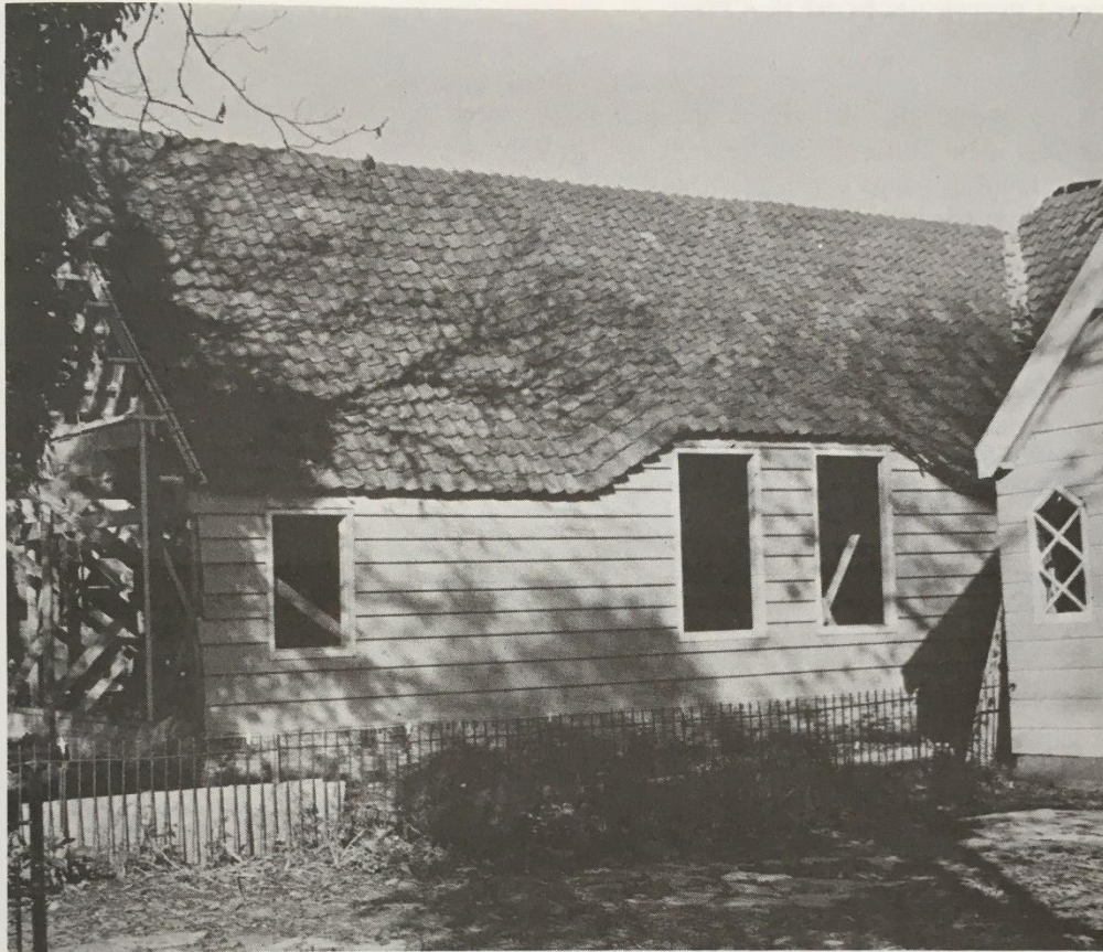
Hetzelfde pand, met reeds vernieuwd dak en aangebouwd vierkant

gen worden gekoesterd. Het is niet duidelijk waarom bij deze grootscheepse aanplant niet uitgegaan werd van het door deskundigen opgesteld Bomenplan, dat in 1970 de gemeente is aangeboden. De knotwilgen langs de Keerngouw passen daar goed, maar de sierbomen, als bijv. prunus, langs het Havenrak zijn geen gelukkige keus.