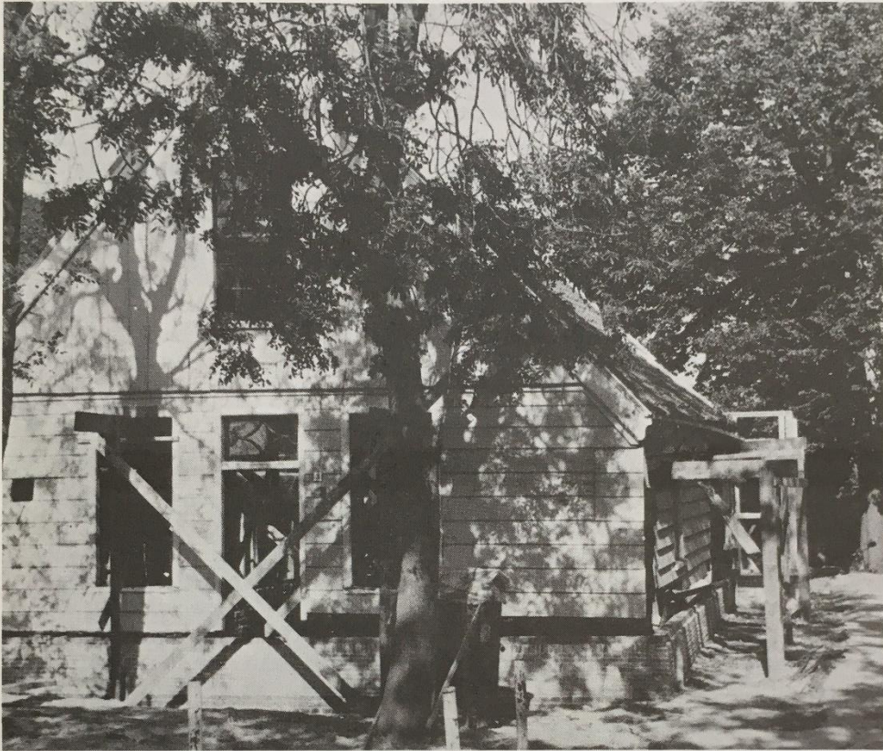
Dorpsstraat 3, bij de aanvang der werkzaamheden