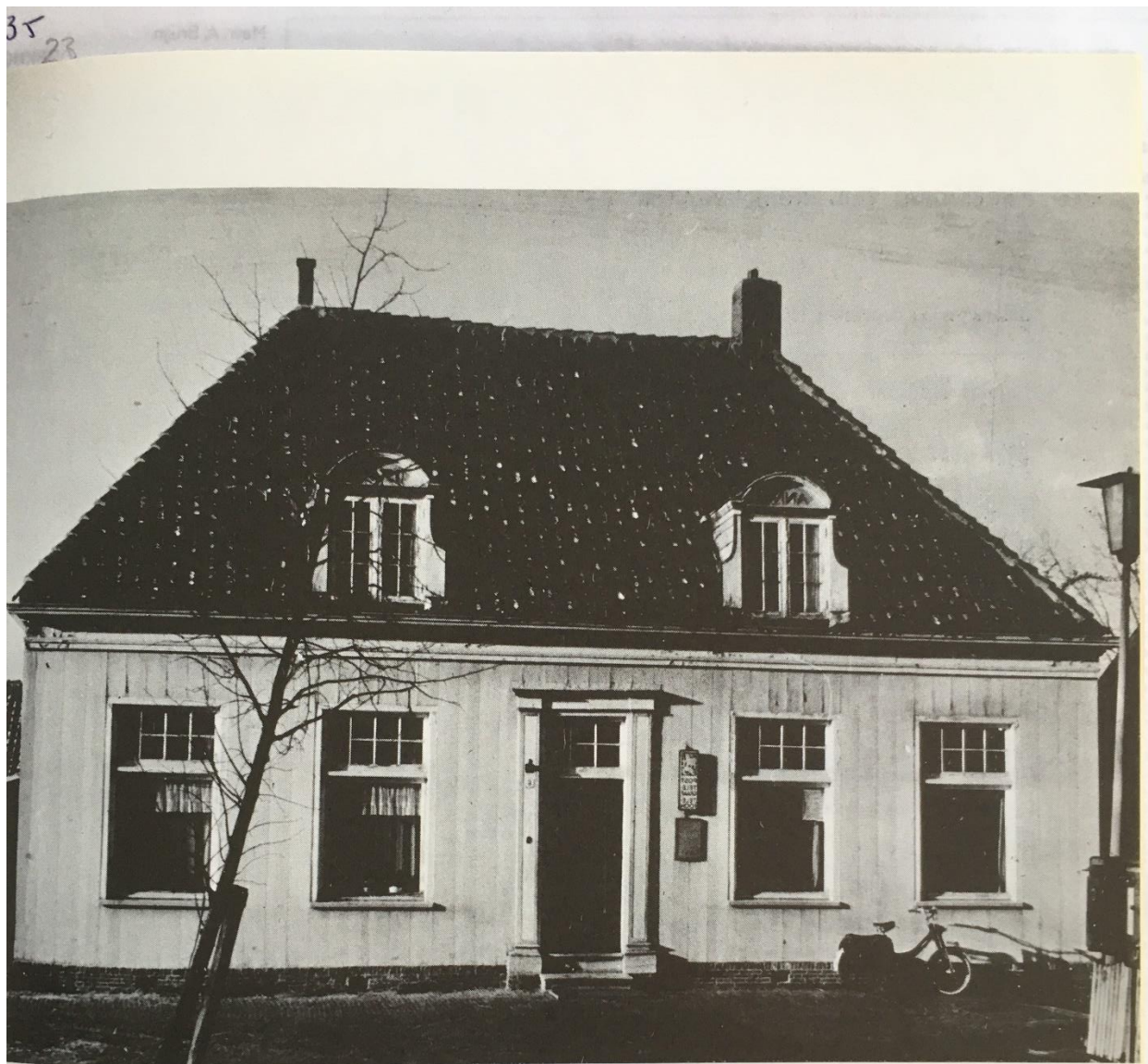
Het postkantoor aan het Kerkplein. Er is onlangs een begin gemaakt met de restauratie i.v.m. de bestemming als Secretarie