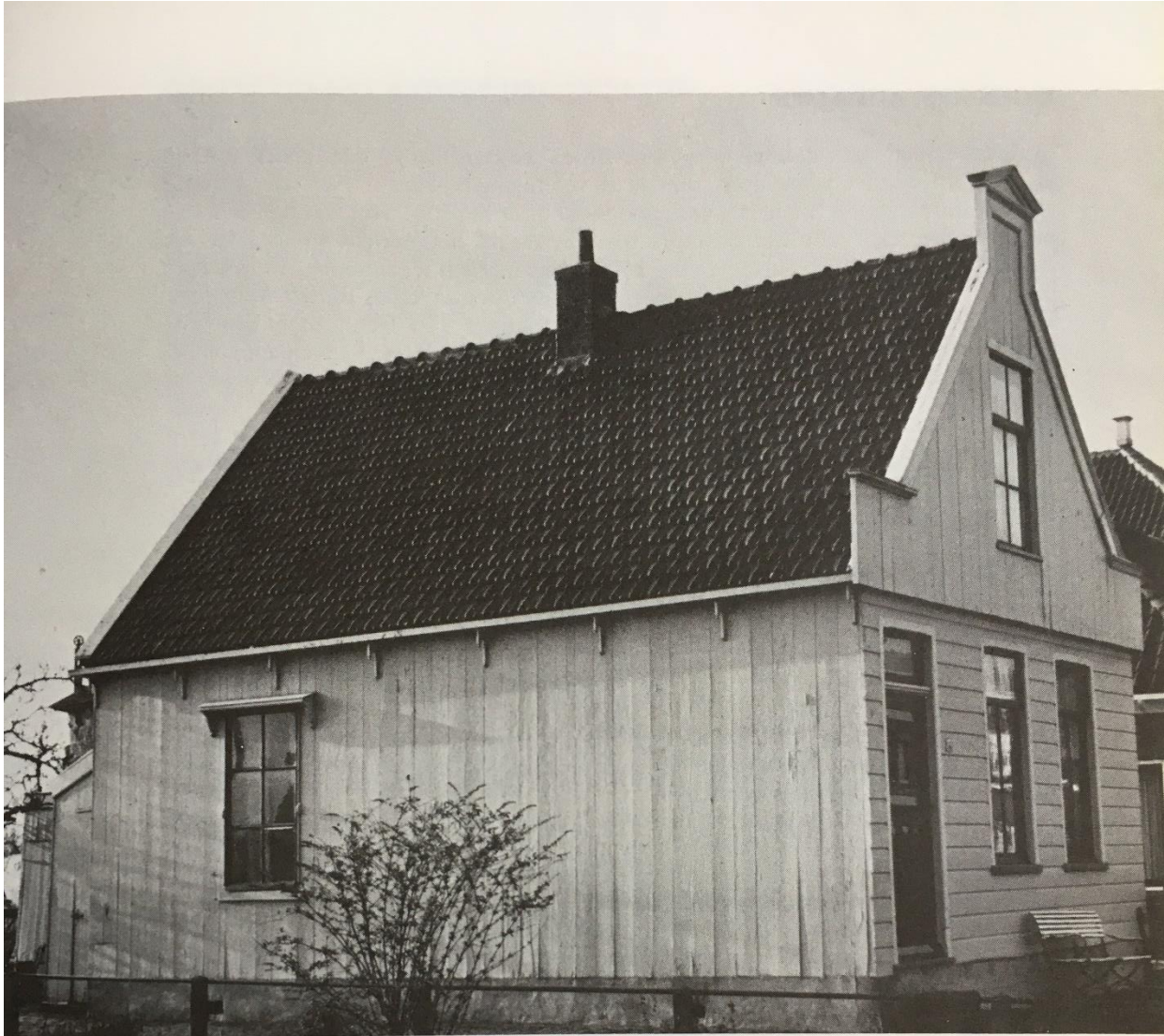
Een echt Waterlands huis: Molengouw 14; eenvoudig en authentiek. Moge het nog lang in deze pretenteloze vorm gehandhaafd blijven