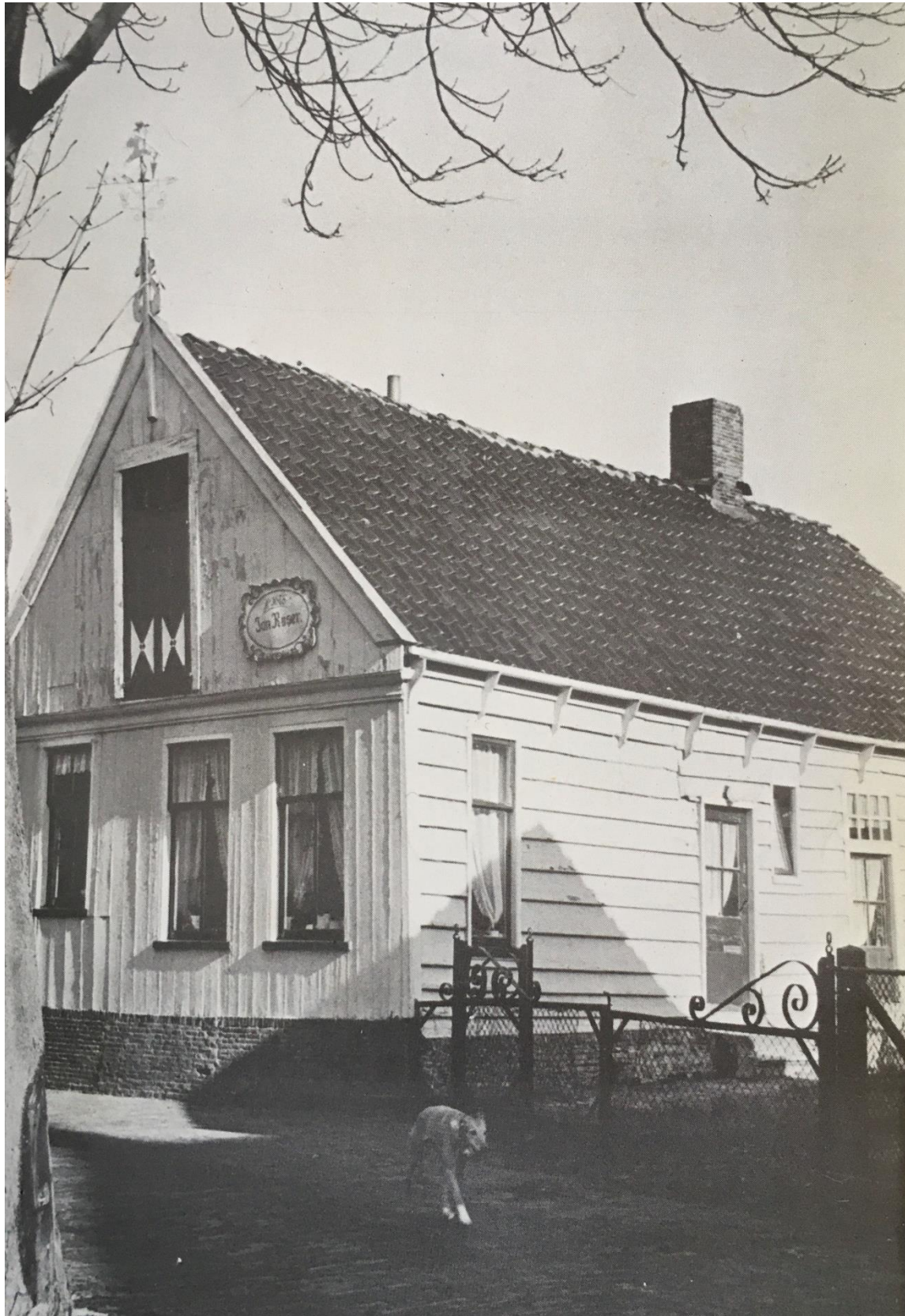
VERENIGING OUD BROEK IN WATERLAND Verslag over het jaar 1972