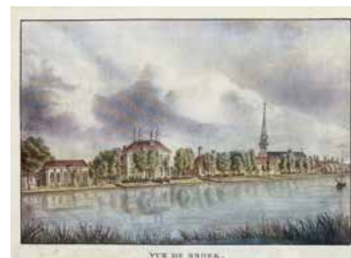
In het midden 't vermaard steenen huys met zijn vier schoorstenen aan de Erven,