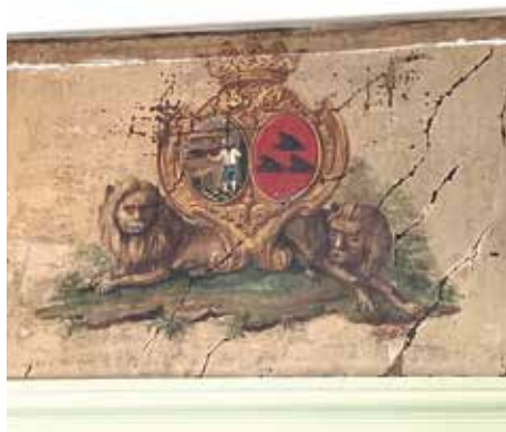
Aan de Erven 34 bevinden zich vandaag de dag nog twee schilderijen met de wapens van de familie Bakker.

werd gedreven met landen aan de Oostzee en de Atlantische Oceaan. Hij was een van de eerste kooplieden die zich gingen bezighouden met het verzekeren van schepen tegen piraterij en schipbreuk. Jan Baltusz woonde aan Havenrak 9 totdat hij in 1756 't vermaard steenen huys aan de Erven kocht.