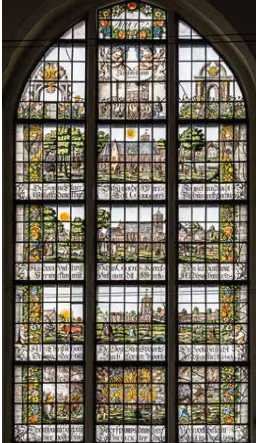
Gebrandschilderd raam in de Broeker Kerk.