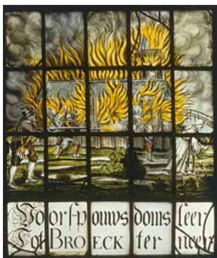
Het gebrandschilderde raam in de kerk van Broek in Waterland. Het geeft de verwoesting in 1573 en de wederopbouw weer die in 1628 een eerste aanvang nam.