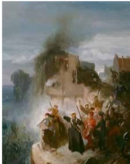
Geuzen strijden op de Diemer Zeedijk in 1573.

Het pakt echter goed uit voor de Geuzen en Oranje. De Spanjaarden hebben pech met het weer. Ze zitten twee weken vast bij Durgerdam waardoor een versterking van de Geuzen zich