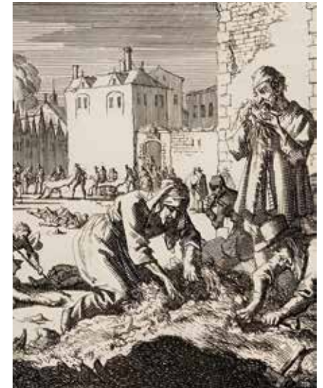
Hongersnood tijdens het beleg van Haarlem in 1573.

De Geuzen doen er alles aan om de bevoorrading van het belegerde Haarlem in stand te