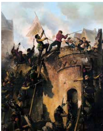
1573 ALCMARIA VICTRIX 'Bij Alkmaar begint de Victorie.'