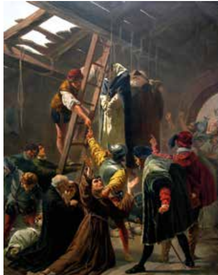
Martelaren van Gorcum, 19 katholieke geestelijken worden opgehangen in Den Briel in 1572.

De meeste steden en gezaghebbers aarzelen in het begin. Ze voelen zich het best bij een neutrale en tolerante houding. Anderen kiezen wel partij, vaak gedreven door plaatselijke omstandigheden. Zo blijft Amsterdam koningsgezind en katholiek omdat de mensen erop vertrouwen dat hun regenten in staat zijn de Spaanse belasting tegen te houden en een eigen garnizoen te onderhouden.