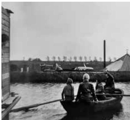
Oversteek over de Broekervaart.